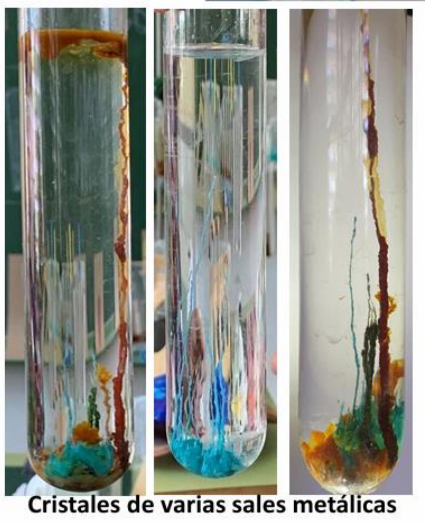
Cristales de varias sales metálicas