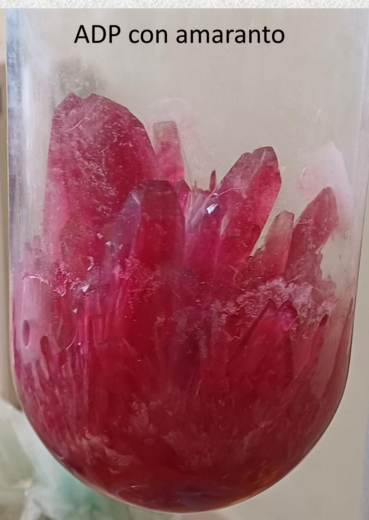
ADP con amaranto