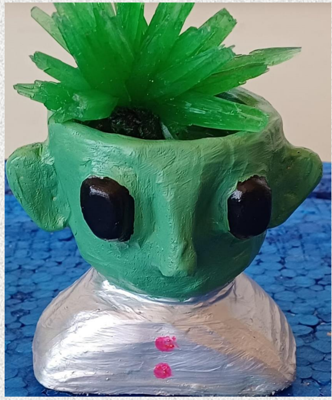
Nuestra mascota Doctora Cristal